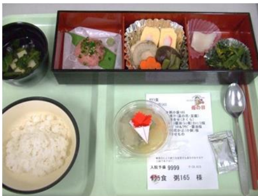
母の日献立 炊き合わせ、ネギトロ