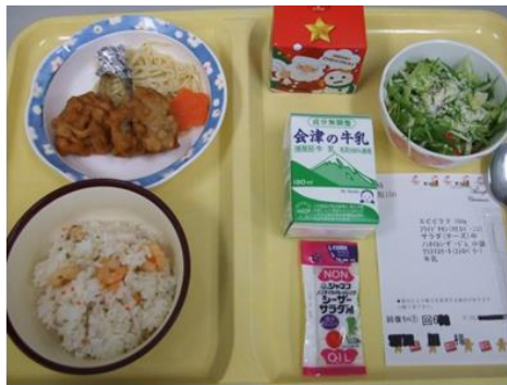
クリスマス えびピラフ チキン、ショートケーキ