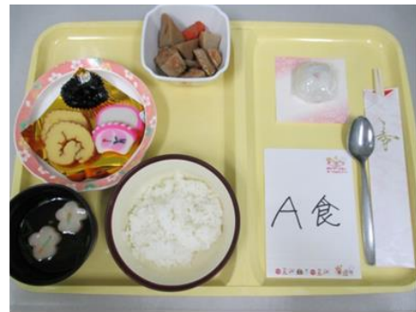
お正月(元旦) おせち、紅白まんじゅう