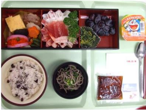
祝膳 赤飯、刺身、そば