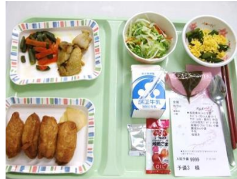
お花見献立 いなり寿司、さくら餅