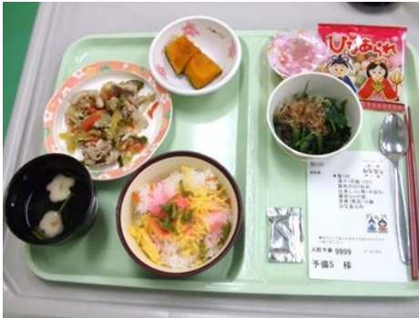
ひなまつり献立 ちらし寿司、お吸い物で春を演出